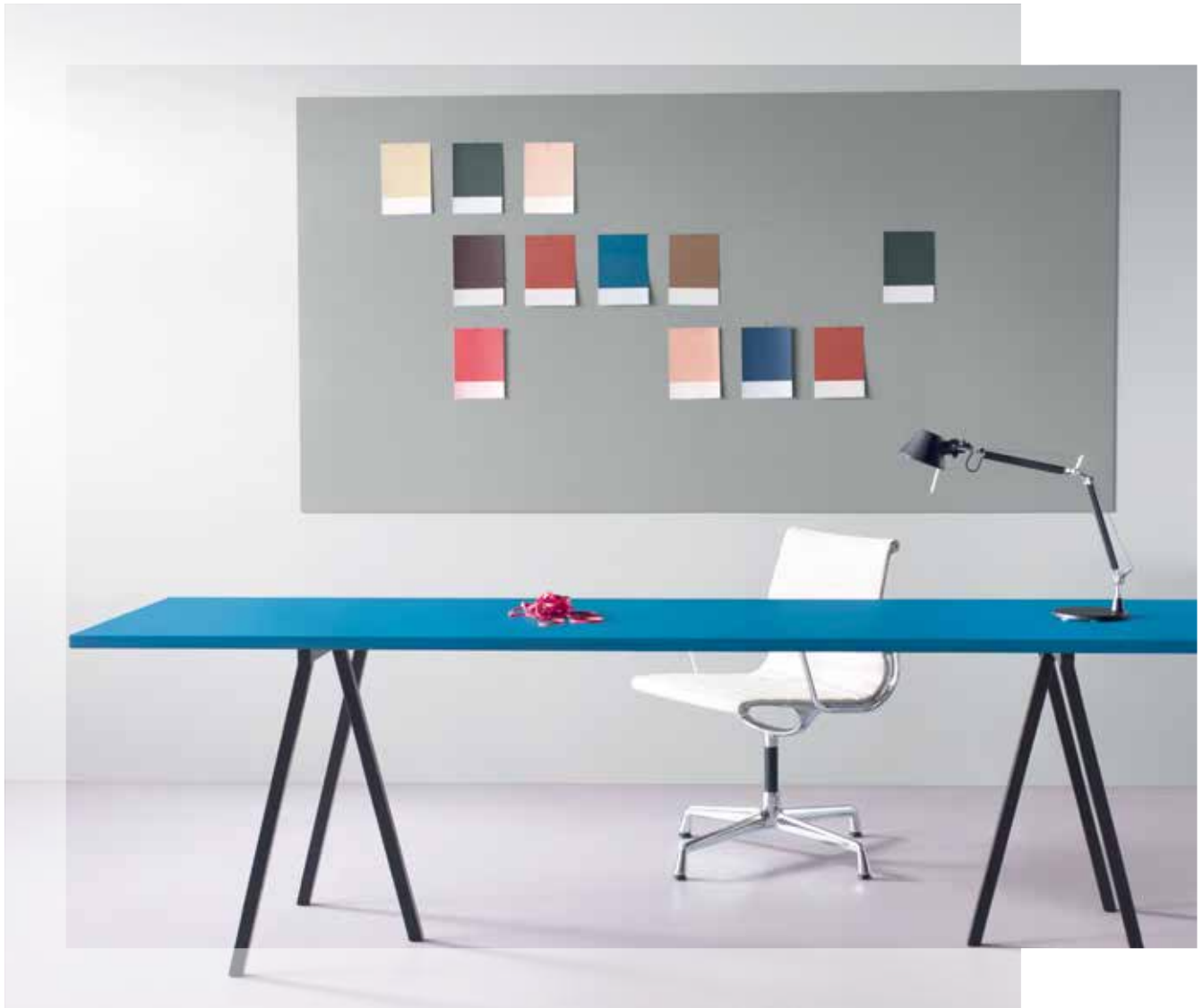
TABLEAU D’AFFICHAGE LINOLEUM