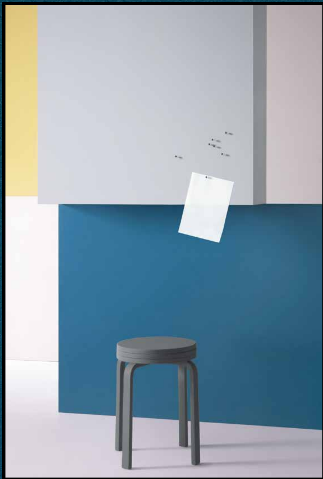
2162 | duck egg 2186 | blanded almond 2214 | blue berry 3363 | walton lilac