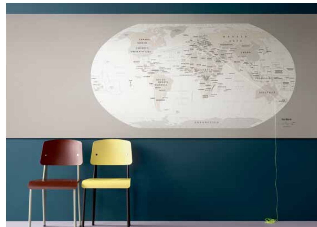
2182 | potato skin 3363 | walton lilac

Bulletin board est fourni en rouleau, jusqu'à 28 m de long et 1,22m de large, approprié pour une pose dans des grands espaces* telles que les salles de conférences ou le long d'un couloir.