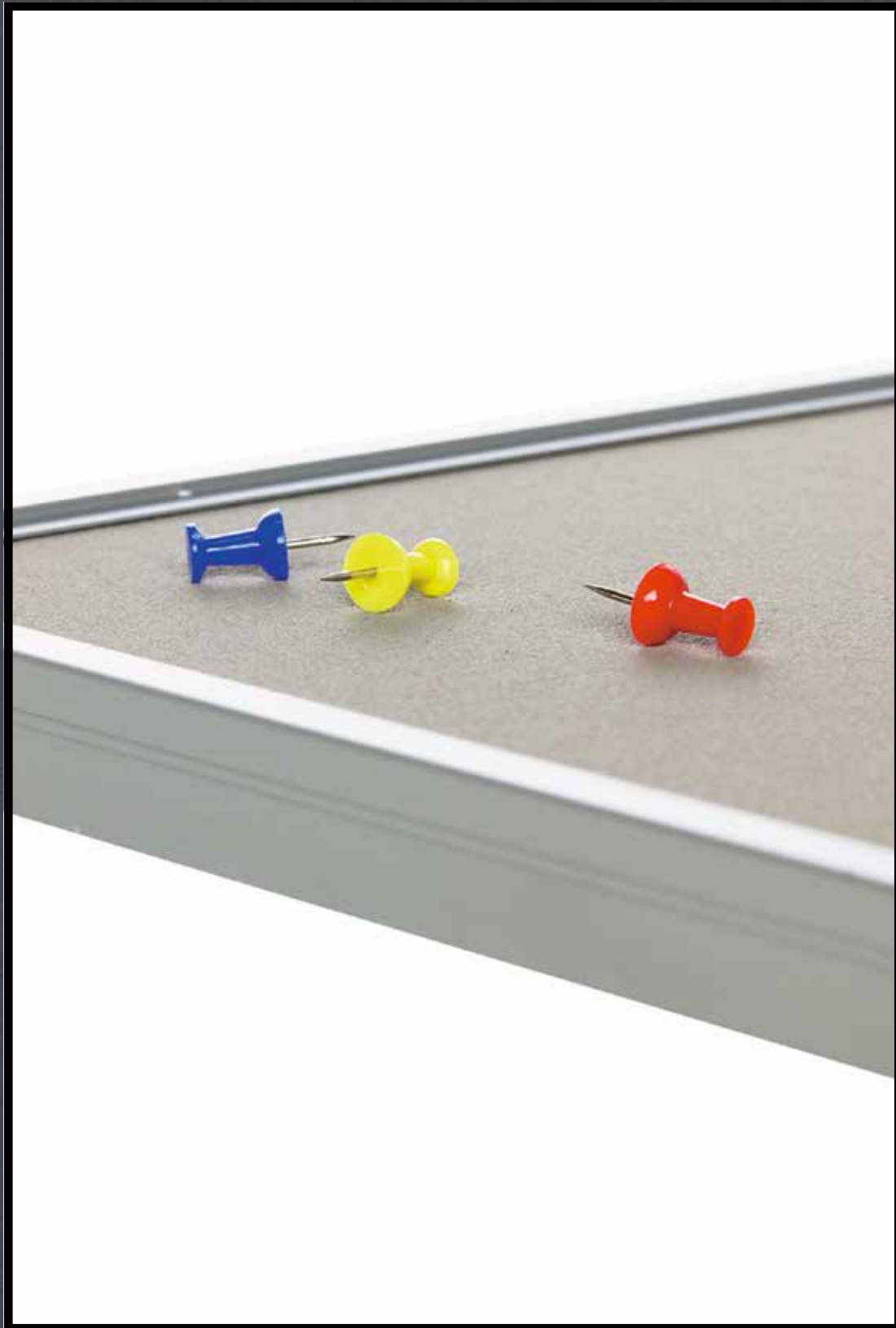
2187 | brown rice