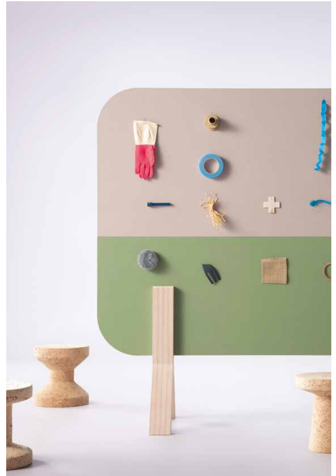
2187 | brown rice 2213 | baby lettuce 3363 | walton lilac

Bulletin board offre une solution idéale pour des environnements tertiaires modernes et durables où les cloisons de séparation ou bien les éléments de mobilier peuvent fusionner pour diffuser l'information.