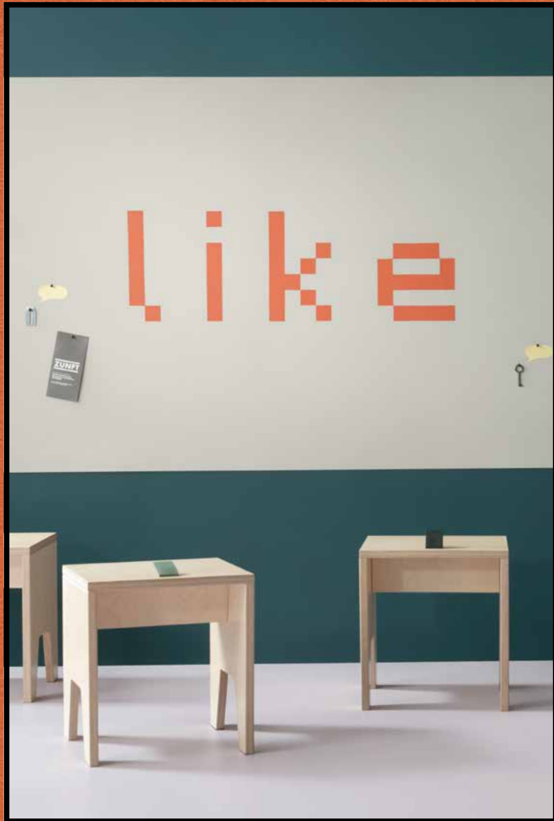
2206 | oyster shell 2211 | tangerine zest 3363 | walton lilac