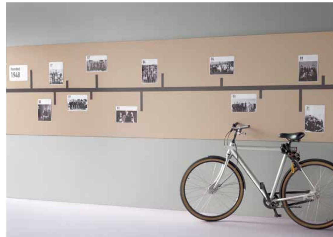
2186 | blanded almond 3363 | walton lilac