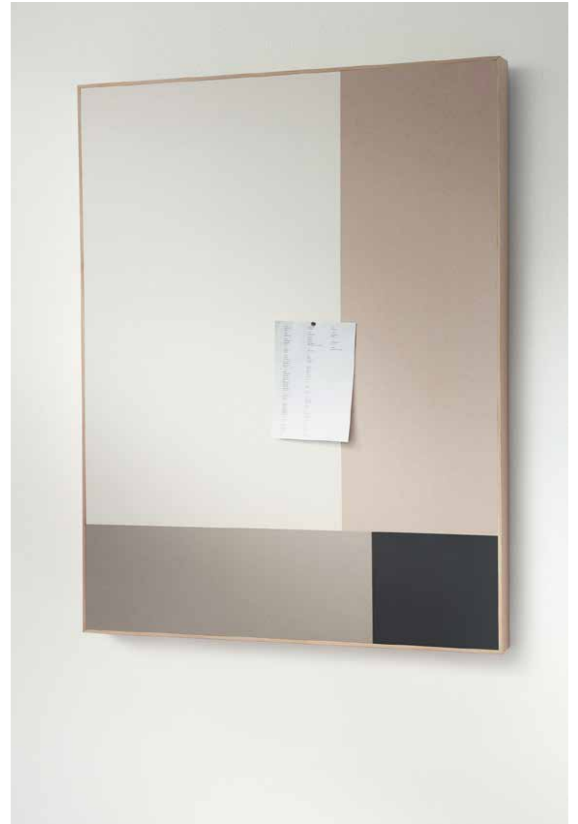
2182 | potato skin 2187 | brown rice 2206 | oyster shell 2209 | black olive

Grâce à Bulletin board, vous pouvez réaliser des panneaux avec une ou plusieurs couleurs, et ce aux dimensions qui répondent à vos besoins.