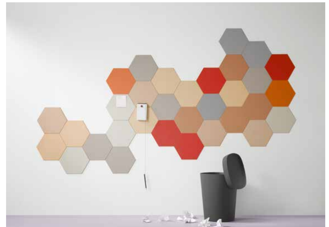
2210, 2207, 2166, 2162, 2206, 2182, 2187, 2186, 3363 | walton lilac

Bulletin board est flexible, facile à couper et à manipuler ce qui permet de créer un panneau mural décoratif avec des effets géométriques par exemple.