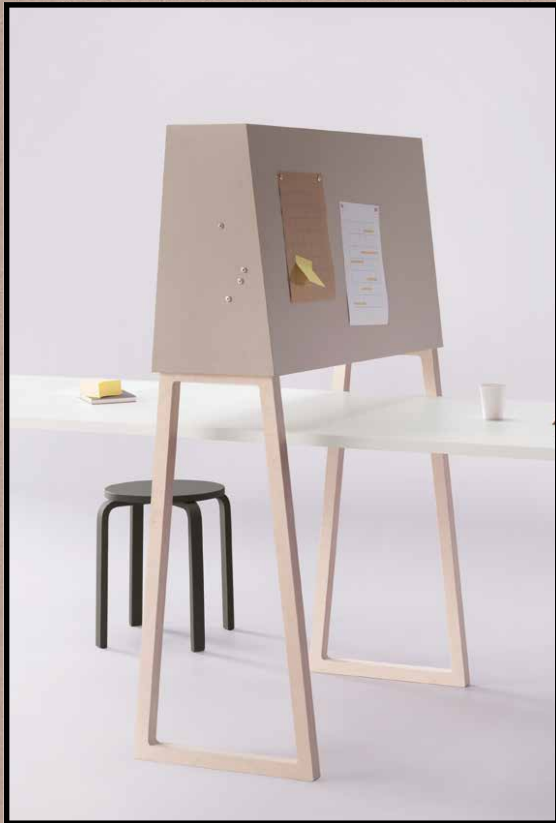
2187 | brown rice 3363 | walton lilac